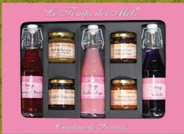
GRAND COFFRET SUCRE 3 BOUTEILLES 4 POTS ref 1100 cdt 4