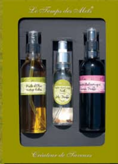
COFFRET 3 SPRAYS 2 SPRAYS 20CL | SPRAYS 10CL ref 1400 cdt 4