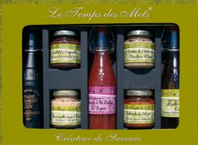
GRAND COFFRET SALE 3 BOUTEILLES 4 POTS ref 1101 cdt 4