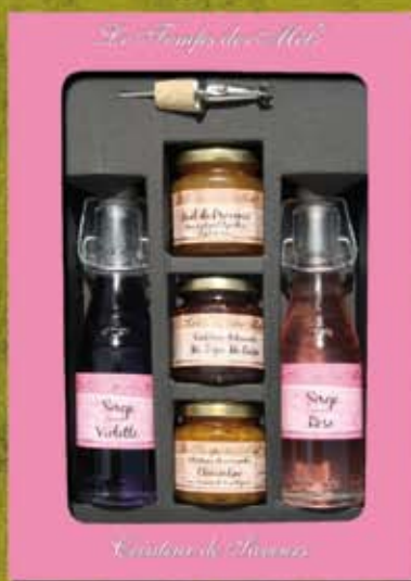
PETIT COFFRET SUCRE 2 BOUTEILLES 3 POTS ref 1300 cdt 4