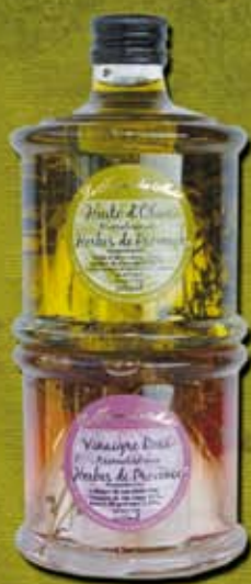
DUO EMPILABLE DUO EMPILABLE (H/O + Vin H/P) 2X250 ML ref 38 cdt 6