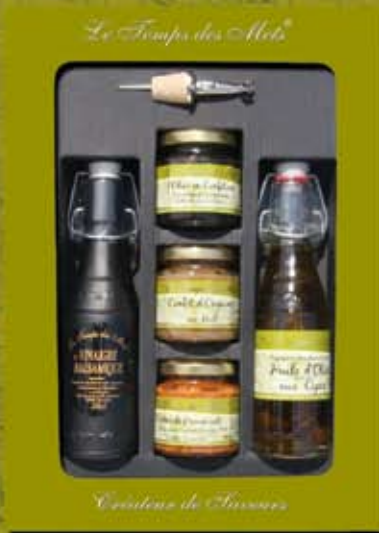
PETIT COFFRET SALE 2 BOUTEILLES 3 POTS ref 1301 cdt 4