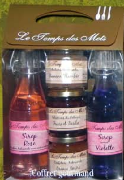
COFFRET GOURMAND ref 58 cdt 1 Vendu vide et à composer vous même 2 bouteilles 20cl, 3 POTS ou 3 bouteilles 20cl ou 9 pots de 125G